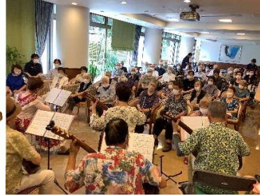
ギターサークルの方 に来ていただき演奏を してくださいました！