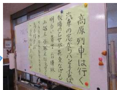
7月にも音楽レク 七夕企画を 実施しました(^^)/