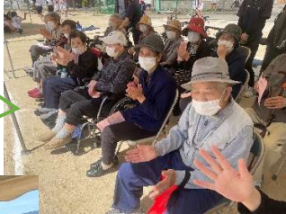
可部中学校の 体育祭の観覧に 行ってきました(^^)/