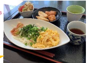
夏といえば！そうめん!!! ゴーヤチャンプルーも作りました♪