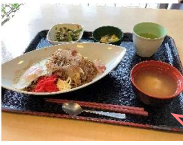
屋上でできた 野菜を使って焼きそばを 作りました☆